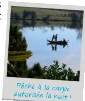
Pêche à la carpe autorisée la nuit !

Balade nature animée par l'association « Arbres et Paysages d'Autan » les mardis 5 et 19 juillet - 2 et 16 août. Voir au dos.