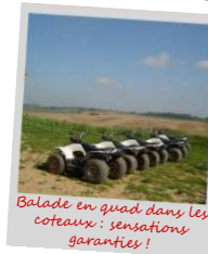
Balade en quad dans les coteaux : sensations garanties !

Guide des loisirs en Pays Lauragais - Voir au dos